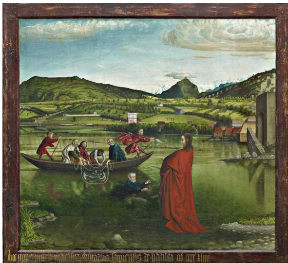
콘라드 비츠(Konrad Witz, 1400-1445), 1444년경 제작 나무 위 유화, 134.6 × 153.2cm / 제네바 미술관, 스위스

독일 출신의 콘라드 비츠라는 화가가 제작한 작품으로, 인물만큼 풍경에도 큰 중점을 둔 르네상스 시대 최초의 작품으로 알려져 있다.