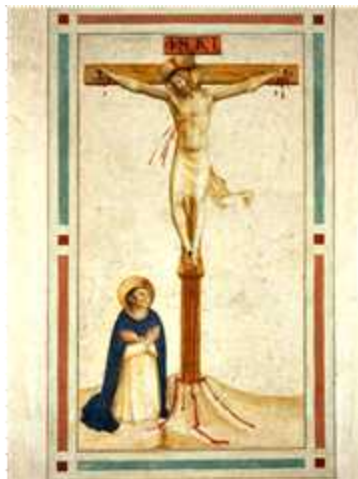
프라 안젤리코 공방, 1442년경 제작 / 프레스코화, 155x80cm 산 마르코 수도원 수련 수사 방 16~18번, 이탈리아 피렌체

도미니코회 산 마르코 수도원 기숙사 중 남쪽에 있는 수련 수사의 방(15번~21번 7개)은 온통 하얀 벽과 천장에 작은 침대와 책상이 있고, 한쪽 벽에는 1440년대 초 프라 안젤리코 공방이 그린 프레스코화가 걸려 있다. 각 프레스코화에는 십자가 위에서 피를 흘리시는 예수님과 그 아래에서 기도하는 성 도미니코 성인(도미니코회 창립자)의 모습이 반복적으로 등장한다. 평범한 흰 배경 위에 그려진 선명한 붉은 피는 손과 발, 옆구리 상처에서 떨어져 나와 보는 이를 향해 ‘분출’되고, 십자가 받침을 타고 메마른 땅으로 흘러내린다. 이 프레스코화들은 도미니코회에 막 입회한 약 14~16세의 어린 수련 수사들을 위해 제작된 것으로, 그들의 신앙 교육과 관상 훈련을 위한 것이었다.